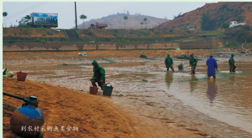
到农村采购鱼类食物

对垃圾食品的危害性认识不够。甚至在人们普遍营养过剩的当今,居然有人担心孩子营养不够,居然认为含乳饮料可以补充营养,如此等等。对此,全体师生要有清醒的认识,积极配合学校食堂工作。具体要求是:相信学校食堂一日三餐对营养的科学均衡搭配,不拒绝洋葱、海带、萝卜、苦瓜等具备健体功能的蔬菜,遇菜吃饭不挑食,逢辣吃辣遇咸吃咸,不暴饮暴食,按时吃饭八成饱,下一餐开餐前一个小时感觉肚子饿,是食量的最佳状态。