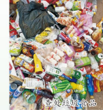
学校垃圾分类处理

总的原则是,谁产生的垃圾谁处理。学校公共场所基本不设垃圾箱,师生产生的废纸等带回自己的垃圾袋,各班级统一交学校废品回收员换钱做班费。烂桌凳子等统一交锅炉房废物利用。瓜皮果皮青菜叶等统一回收交学校猪场。个人产生的不可回收垃圾,自己带回家处理。从即日起,学校将严查利用快递网购违禁物品进校园。凡违背规定者,一经抓获,上交100元垃圾处理费,利用快递违规者加倍处罚。