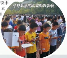
中源自原菜之新鲜蔬菜